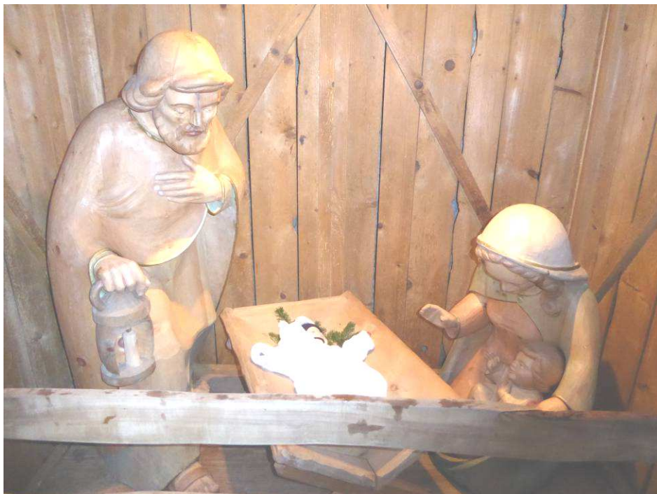
Krippe am Mönchsberg in Salzburg