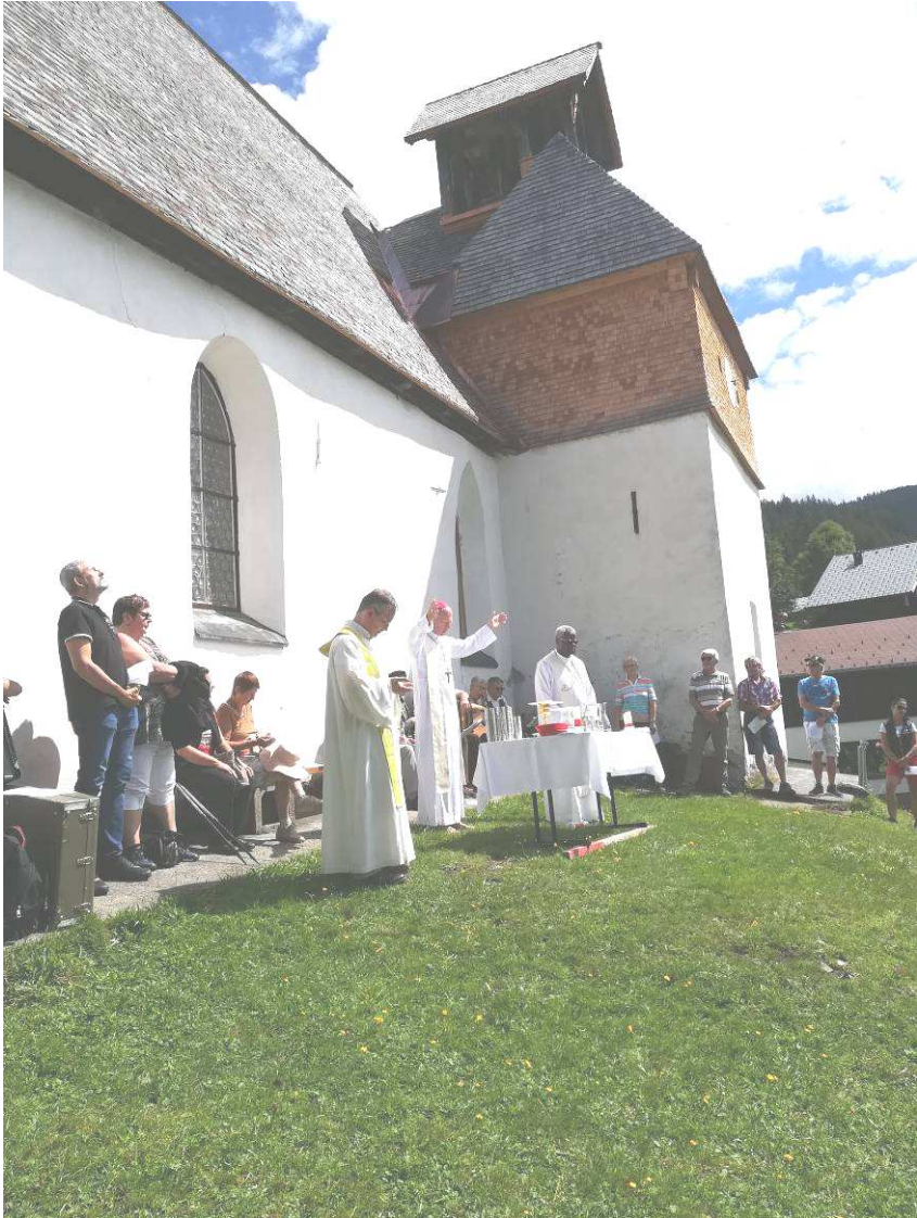
Gemeindeausflug Kristberg mit Bischof Lederleitner am 15.August 2020