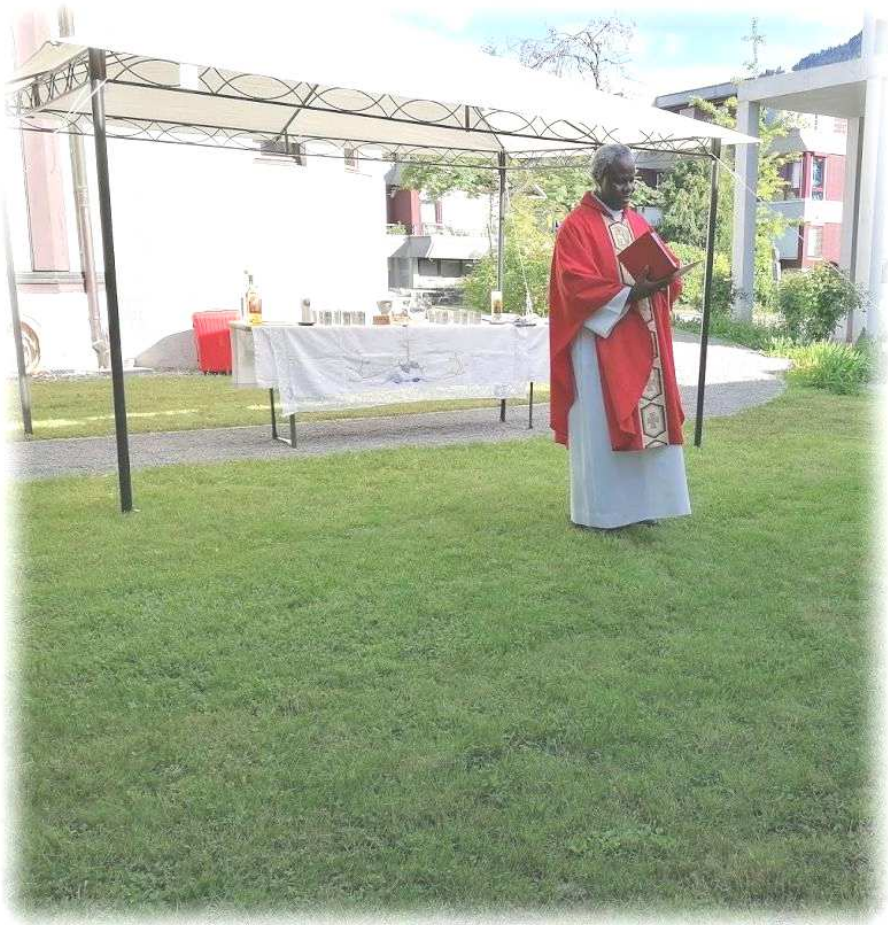
Pfingstgottesdienst am 23. Mai 2021 im Garten der Evangelischen Kirche Dornbirn